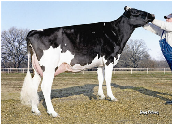
MISS ELEGANT DELIGHT GRANDDAM