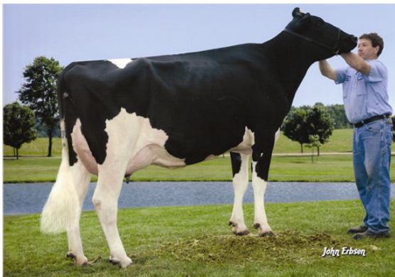
WINDSOR-MANOR Z-DELIGHT THIRD DAM